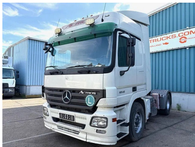
Mercedes-Benz Actros 1846 LS (MP2) (EPS WITH CLU... 4x2 Referentienummer: SN 58985332 Z